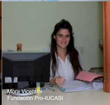
Mora Vicentini Fundación Pro-IUCASI